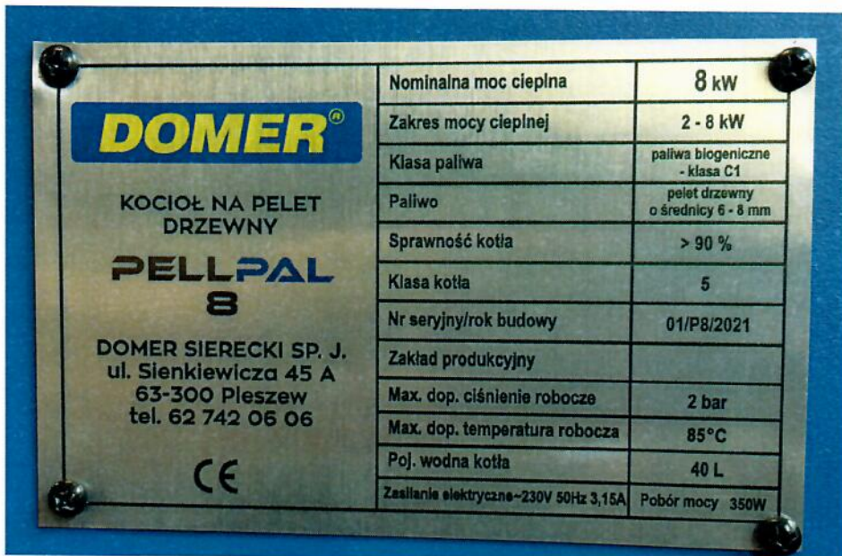
Rysunek 3. Tabliczka znamionowa kotła PELLPAL 8 (dane uzyskane od klienta)

Identyfikacji badanego kotła dokonano w oparciu o dokumentację techniczną i instrukcję obsługi. Tabliczkę znamionową przedstawiono na rysunku 3. Podstawowe dane techniczne kotła umieszczono w instrukcji obsługi kotła.