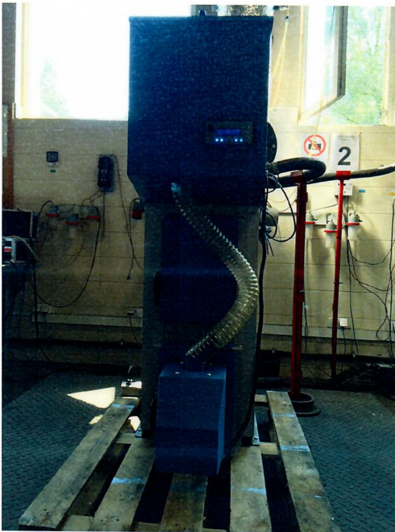
Rysunek 1. Fotografia kotła PELLPAL 8

Wewnętrzne ściany korpusu wodnego kotła wykonane są ze stali konstrukcyjnej S235JR o grubości 5 mm, zewnętrzne ze stali konstrukcyjnej S235JR o grubości 3 mm. Zewnętrzną część korpusu zaizolowano cieplnie wełną mineralną i pokryto cienką blachą. Kocioł posiada izolowane stalowe drzwi popielnikowe, w których zamontowany jest palnik peletowy i jedno drzwi obsługowe. Komora paleniskowa wykonana jest w kształcie prostopadłościanu, otoczona płaszczem wodnym. Przystosowana jest do spalania paliw stałych pochodzenia mineralnego. Pod paleniskiem znajduje się popielnik. Na dnie komory paleniskowej umieszczona jest szuflada na popiół. Poziomy wymiennik ciepła zbudowany jest z poziomych półek płytowych, stanowiących kanały wodne. Część konwekcyjną korpusu wodnego umiejscowioną nad komorą paleniskową, tworzą trzy poziome ciągi konwekcyjne. Z trzeciego konwekcyjnego kanału spaliny trafiają do czopucha kotła o przekroju kołowym. Nad górną powierzchnią kotła znajduje się zasobnik paliwa. Paliwo do palnika dostarczane jest z zasobnika automatycznie podajnikiem ślimakowym. Powietrze do spalania dostarczane jest przez dmuchawę, która jest integralną częścią palnika. Kocioł przeznaczony jest do pracy w instalacji wodnej zabezpieczonej naczyniem wzbiorczym systemu otwartego. Kocioł wyposażono w króciec wylotu spalin o średnicy \phi -130mm, króciec zasilania/powrotu wody kotłowej G 1". Pracą kotła steruje regulator pracy kotła firmy Elektro-Miz, typu Mini Ster PID Kolor.